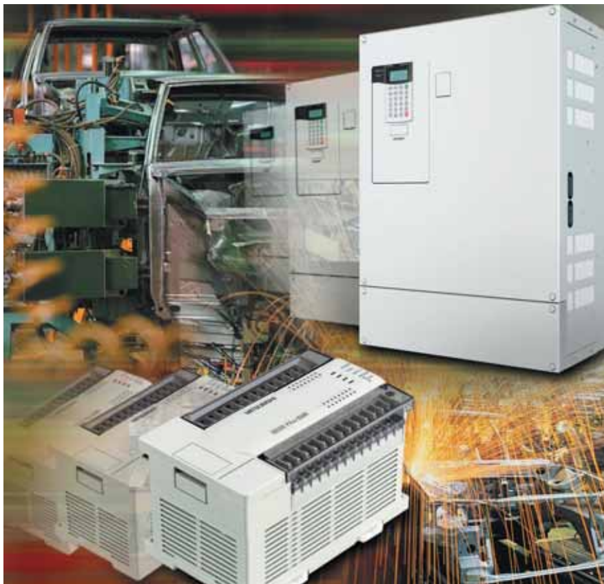
Только один пример из многих, типичных для автомобилестроительной промышленности.

Вот уже более 25 лет, как компания Mitsubishi Electric открыла в Европе восемь представительств, занимающихся вопросами промышленной автоматизации. Эта весьма обширная сеть, выстроенная на добрых отношениях и надежном партнерстве, все время интенсивно развивалась и до сих пор продолжает расширяться.