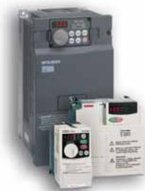
Надежные, успешные, удобные в эксплуатации: преобразователи частоты от Mitsubishi

Mitsubishi предлагает, пожалуй, самый большой по нынешним временам выбор эргономичных и удобных для пользователя устройств человеко-машинного интерфейса, начиная с текстового дисплея, через сенсорные экраны и вплоть до промышленного панельного компьютера.