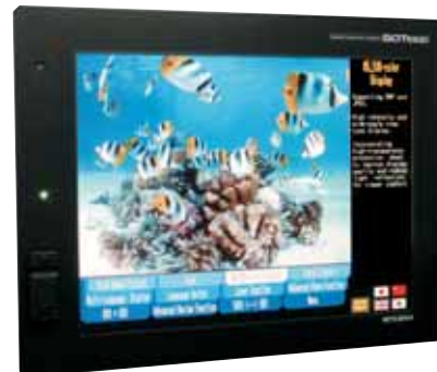
Четкость изображения, размер и цветопередача: панели оператора серии GOT от компании Mitsubishi являются безусловными лидерами.