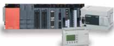
Модульные и компактные ПЛК от Mitsubishi Electric