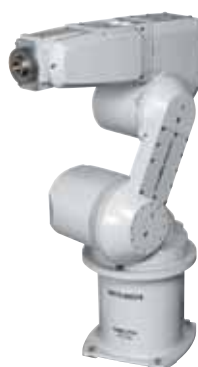
Роботы от Mitsubishi: высокоточные и долговечные